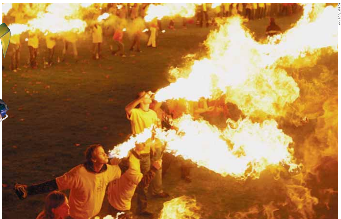
Een wereldrecordpoging simultaan vuurspuwen, gisteravond op de campus van de Technische Universiteit Eindhoven.

LAURA ROMANILLOS laura.romanillos@metronieuws.nl